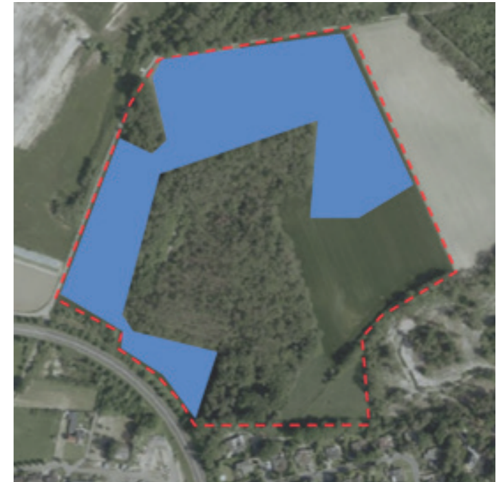
Plangebied zilverzandwinning de Kakert. De rode lijn laat het plangebied van de ontwikkeling in de Kakert zien. De blauwe vlakken weergeven de feitelijke zilverzandwinning.