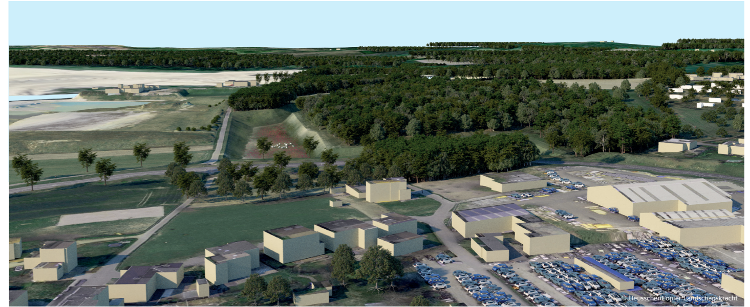
Eindinrichting de Kakert, vogelvlucht vanaf Palemig. Het bestaande bos en markante bomen worden gerespecteerd door voldoende afstand te houden.