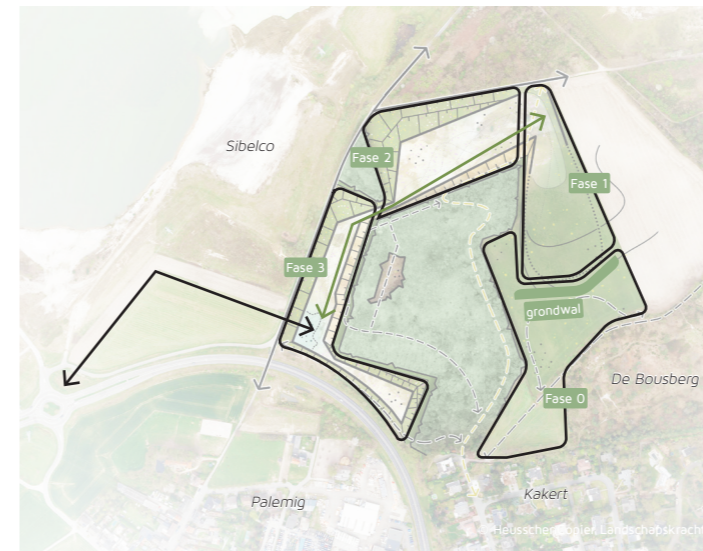
Fasering van de werkzaamheden. De invloed op de omgeving wordt beperkt door een zorgvuldige fasering en tijdelijke verkeersafwikkeling.

Voor Zilverzand Exploitatie Beaujean is het de eerste en de laatste zandwinning in Landgraaf. Wij begrijpen dan ook dat bewoners de angst hebben dat Zilverzand Exploitatie Beaujean eerst het zilverzand wint en dat de omgeving blijft zitten zonder eindresultaat. Dat is duidelijk niet onze bedoeling. Wij hebben daarom aan de gemeente en de provincie ook een gefaseerde winning voorgesteld.