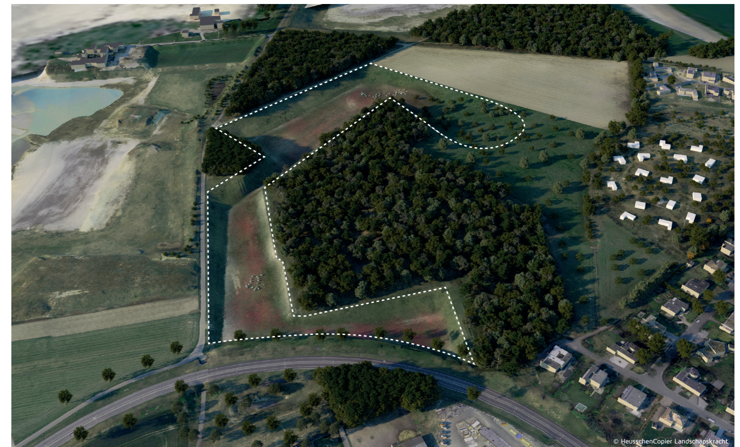
Eindinrichting de Kakert, vogelvlucht vanaf De Bousberg. Het cultuurlandschap achter De Bousberg loopt geleidelijk over in een flauw droogdal.