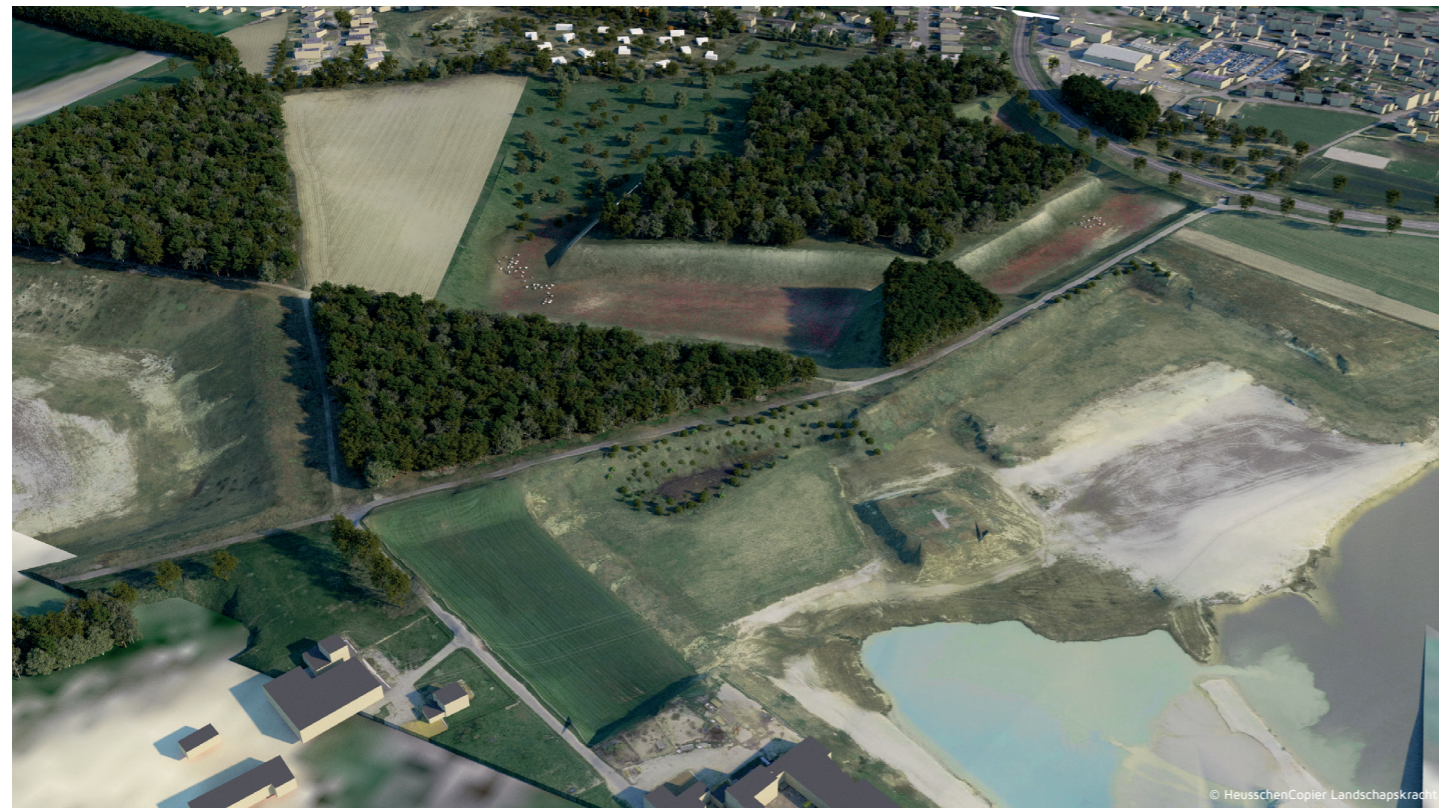
Eindinrichting de Kakert, vogelvlucht vanaf Sibelco. De tot natuurgebied ingerichte zilverzandwinning gaat aansluiten op bestaande (groeve)natuur.

Alle werkzaamheden zullen enkel op werkdagen én overdag plaatsvinden. In de weekenden en tijdens feestdagen wordt er niet gewerkt. Ook zal er tijdens vakantieperiodes geen zandwinning plaatsvinden. Zoals eerder vermeld is het project uiterlijk 31.12.2023 gereed.